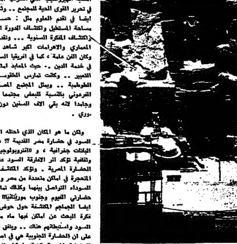
حضارة أفريقيا قديمة جدا ، ويشار الى معابد «ابو سبيل» عادة كليل على ان أفريقيا عرفت مراحل تاريخية على غرار مناطق العالم الأخرى ..

حدود التاريخ الشكلي ، الا حيث وجد الانسان وجد التحول وبالتالي وجد التاريخ (التاريخ دون نص) ، حيث تشارك التنبؤات الجديدة وتطور العلوم في هذا العمل ، في ظل مفهوم جديد للتاريخ الذي يريد ان يكون شاملا بحيث تمثل أهمية لتأثير التاريخ والمبارك بينما تكون الاحية الاولى كما خلفه القدماء .. وهناك صعوبة أخرى تكمن في ان قروننا كاملة غامضة قبل وبعد مولد المسيح مباشرة مما يجعل من الصعوبة بكنسان إعادة التسلسل التاريخي للأحداث .. واعتبرت التقاليد الشفهية من جهة أخرى مصدرا مقبولا شريطة ان تستند بمصدر آخر .. ولكنها تبقى أقل ثقة مما هو مكتوب .. وكان مشاركة العلماء دور كبير في وضع التاريخ في نساه الصحيح وذلك بمساهمة دراسة علم الآثار الذي دل على مجموعة حركات الهجرات ومبادلات الشعوب .. وسبع اختيار الفلور ملا في تاريخ التغيرات واكتشاف الخزون الهائل لارض أفريقيا ..